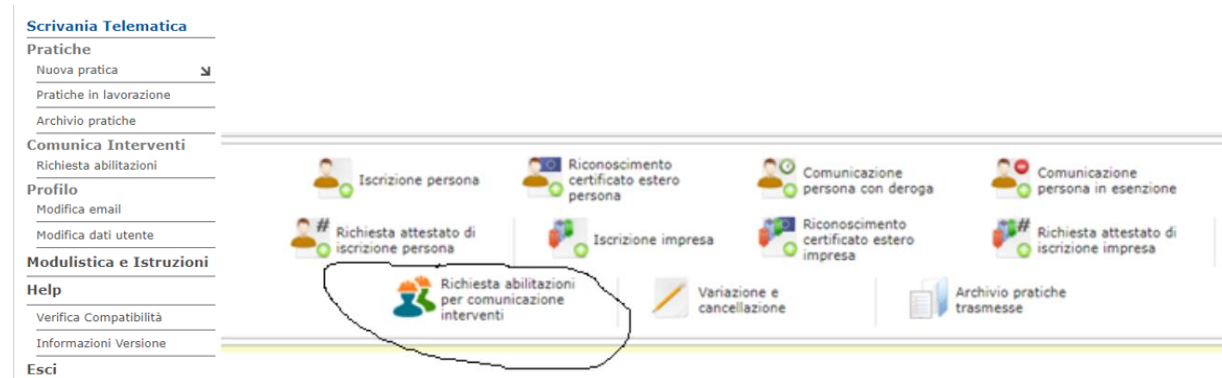
Figura 4 - Pratica di richiesta abilitazioni

L'utente deve selezionare, attraverso il menù di navigazione o scegliendo la corrispondente icona, la pratica di "richiesta abilitazioni per comunicazione interventi".