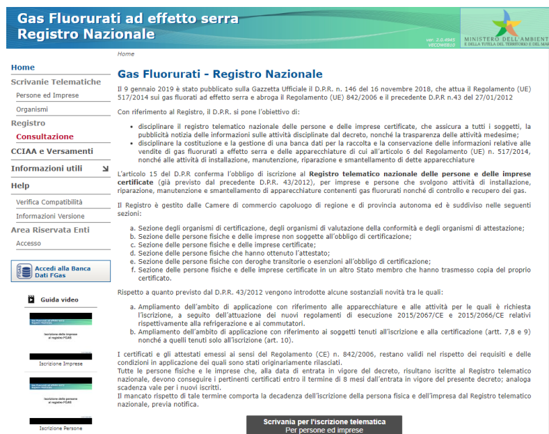
Figura 1 - Home page

La pratica deve essere presentata dal portale del registro FGAS ( www.fgas.it )