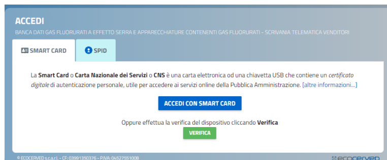
Figura 3 - Scelta metodo di accesso

Si evidenzia che l'accesso con SPID è valido, ma che a completamento della pratica sarà necessario firmare con firma digitale intestata allo stesso soggetto titolare dello SPID.